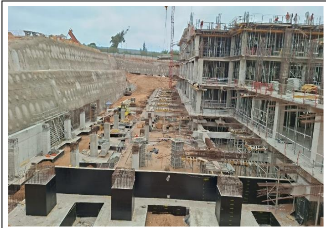
Panorámica sector poniente