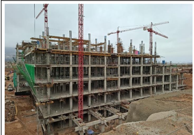
Vista Fachada Nor-Oriente (Sectores A-B)