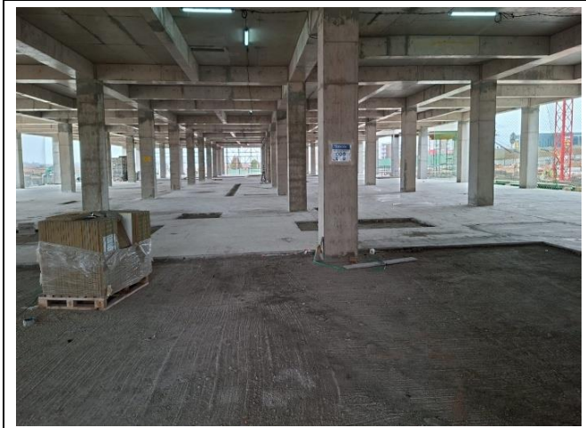
Instalación de Baldosas Nivel 3 (Sectores E-F)