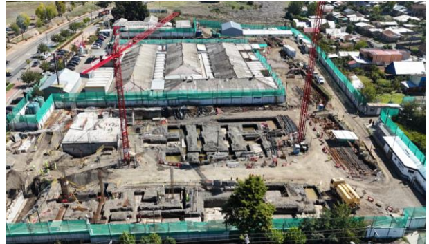
HOSPITAL DE NACIMIENTO