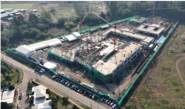
HOSPITAL DE SANTA BÁRBARA